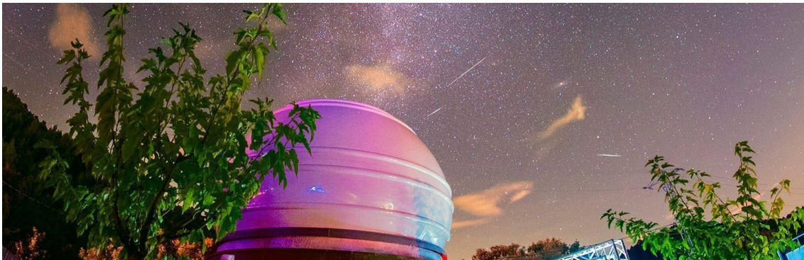
Astronomisches Observatorium auf dem Campingplatz Bassegoda Park (Albanyà)

Ein Campingplatz in der Region Girona, der Bassegoda Park in Albanyà, war der erste, der von der Starlight Foundation ausgezeichnet wurde , und ist damit der erste internationale Sternepark der IDA auf der Iberischen Halbinsel. Die Einrichtung umfasst ein astronomisches Observatorium mit hochmoderner Ausstattung, einschließlich des größten Teleskops in der Region. Seine Einrichtungen reichen von der Popularisierung der Astronomie für ein nicht fachkundiges Publikum bis hin zu wissenschaftlichen Forschungen für professionelle Astronomen.