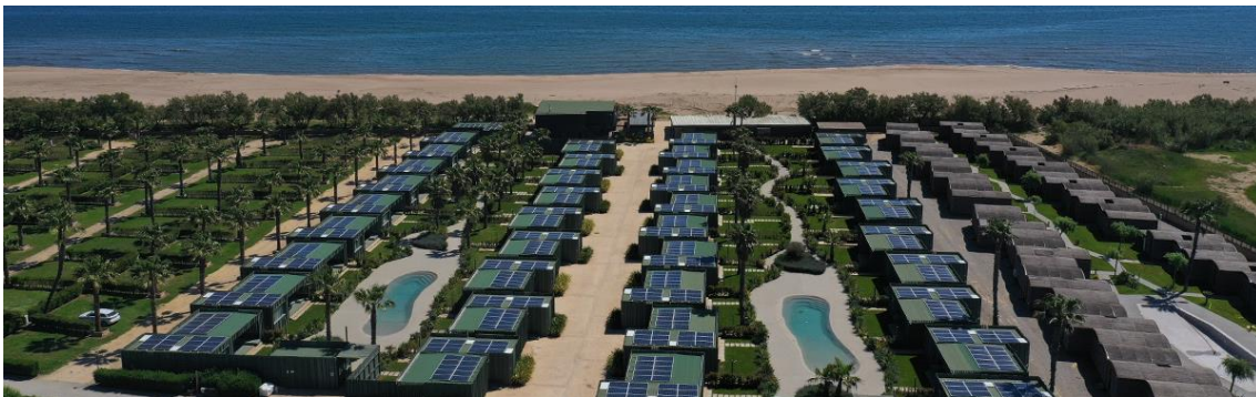
Selbstversorgende Bungalows auf dem Campingplatz Bungalow Resort & Spa La Ballena Alegre Costa Brava (Sant Pere Pescador)

In der Gegend von Girona befindet sich der erste Campingplatz Spaniens mit selbstversorgenden Bungalows: La Ballena Alegre in Sant Pere Pescador (jeder Bungalow verfügt über eine Batterie mit zehn photovoltaischen Paneelen, die Energie sammeln und in Strom umwandeln).