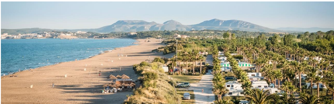
Panoramablick auf das Massís del Montgrí und den Campingplatz Las Dunas (Sant Pere Pescador)

Die wichtigsten internationalen Organisationen der Branche, wie der deutsche ADAC, der niederländische ANWB, der Deutsche Camping-Club DCC oder der britische Reiseführer Alan Rogers, verleihen den Campingplätzen von Girona Jahr für Jahr Auszeichnungen und geben einem Viertel ihrer Stellplätze fünf Sterne.