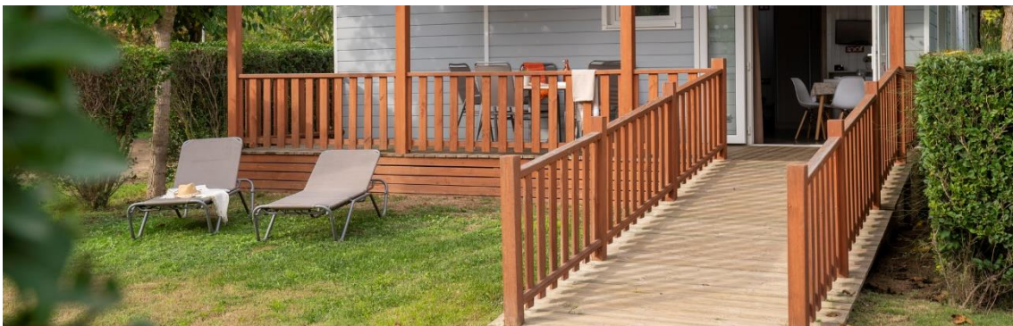
Bungalow für eingeschränkte Mobilität in Càmping Amfora (Sant Pere Pescador)

Die Wheelchair Friendly Campingplätze entsprechen allen Anforderungen an die Barrierefreiheit, die von den Mifas-Benutzern vorher geprüft wurden. Sie schließen alle architektonischen Barrieren aus und bieten Dienstleistungen an, mit denen der Aufenthalt von Menschen mit eingeschränkter Mobilität verbessert wird. Abgesehen von der Installation von Amphibiensesseln für den Meereszugang und von Kränen für die Schwimmbäder, die auf den Campingplätzen von Girona bereits vorhanden waren, gibt es nun Dienstleistungen wie Schwimmbäder mit Zugangsrampen oder hydraulischen Sesseln, Rampen für die Zufahrt zu den Unterkünften und in den Gemeinschaftsräumen sowie integrative Unterhaltungsangebote und vieles mehr. Einige Einrichtungen stellen den Campern außerdem Angebote für barrierefreie Aktivitäten in der Region sowie Fahrräder für Menschen mit Behinderungen zur Verfügung.