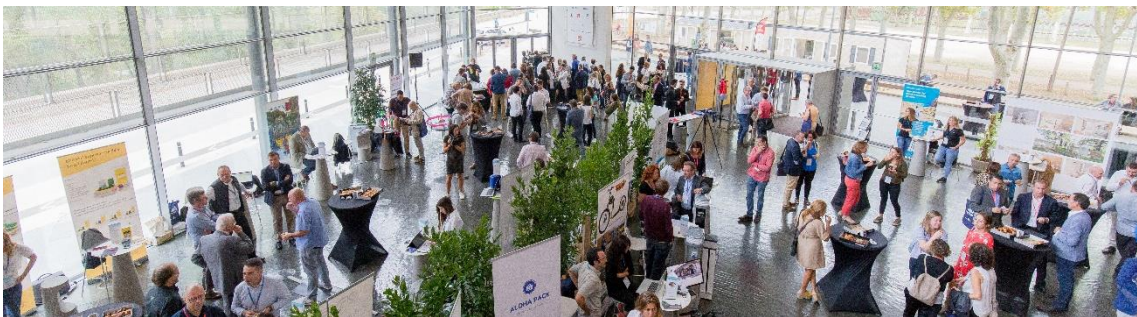
Veranstaltung des jährlichen Girocamping-PRO-Kongresses

Die Vereinigung der Campingplätze von Girona hat den Fachkongress für Tourismus und Camping Girocamping PRO ins Leben gerufen, um Instrumente für die Innovation und bessere Positionierung in der Tourismusbranche bereitzustellen. Die seit 2018 durchgeführte Veranstaltung umfasst hochinteressante Vorträge und Podiumsdiskussionen zu Themen, die für die Branche von Interesse sind, sowie einen Bereich für Networking. Girocamping PRO hat sich zum wichtigsten Kongress des Tourismus in der Provinz Girona und der Campingbranche in Katalonien entwickelt.