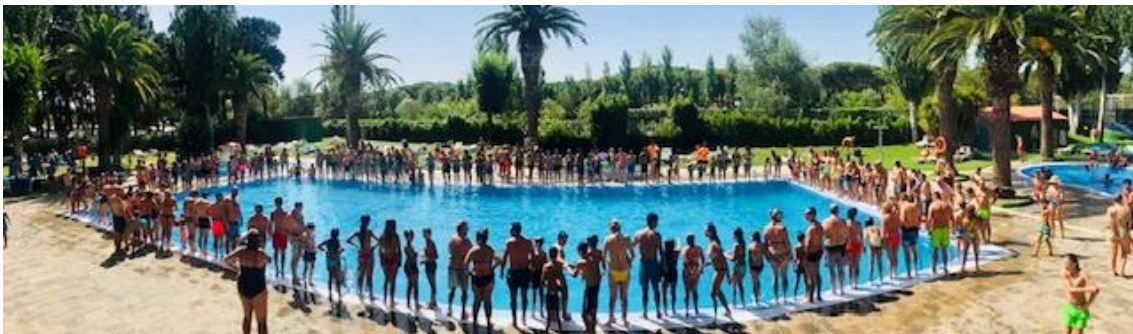
Mulla't per l'Esclerosis Múltiple auf dem Campingplatz Valldaro (Platja d'Aro)

Die Initiative, die 2019 begann, arbeitet in Zusammenarbeit mit der Blut- und Gewebebank, um vermehrt für Blutspenden im Sommer zu werben, und mit der Asociación Pulseras Candela für Spenden zum Zwecke der Forschung gegen Kinderkrebs im Krankenhaus San Juan de Dios in Barcelona.