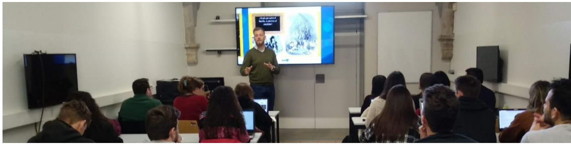
Ausbildung an der Universität von Girona

Seit dem Schuljahr 2018-2019 arbeitet die Vereinigung der Campingplätze von Girona außerdem mit dem INS Illa de Rodes in Roses zusammen, das einen ersten dualen Ausbildungsgang für den Beruf des Animateurs für Sozial- und Sporttourismus anbietet. Die Organisation hatte beim Bildungsministerium der Generalitat beantragt, dass genügend spezifisches und qualifiziertes Personal auf diesem Gebiet ausgebildet werden sollte.