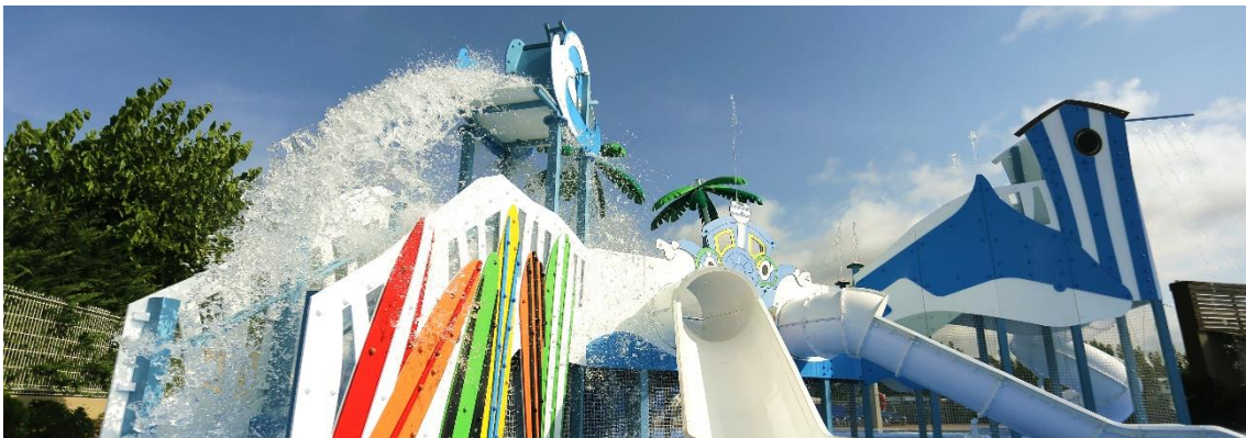
Neue Infrastruktur des Eurocamping-Schwimmbads (Sant Antoni de Calonge)

Die Investitionen zielen auf die Verbesserung der Energieeffizienz ab, u. a. durch Installation von Solar- und Fotovoltaikanlagen und Ladestationen für Elektrofahrzeuge. Die Einrichtungen haben auch in die Qualität der Unterkünfte und Barrierefreiheit für Menschen mit eingeschränkter Mobilität investiert , sowie in die Verbesserung der Gemeinschaftsbereiche (Rezeption, Gastronomie, Gartenanlagen, Schwimmbäder usw.), die Erweiterung des Angebots für Familien und die Schaffung von Räumen, die Telearbeit ermöglichen.