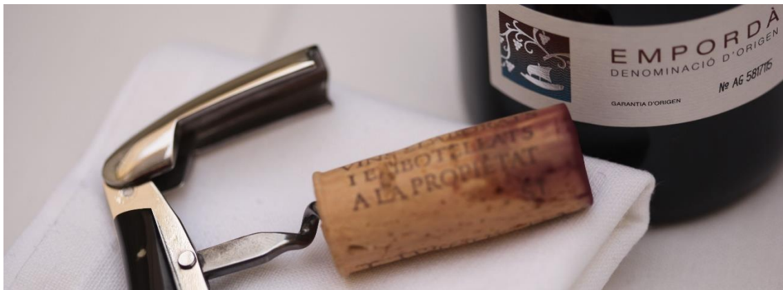
Weinflasche mit der Ursprungsbezeichnung Empordà

Die Vereinigung hat mit der Aufsichtsbehörde D.O. Empordà eine Vereinbarung zur Zusammenarbeit unterzeichnet, um den Genuss und die Kenntnis des lokalen Weins zu fördern. Im Rahmen dieser Vereinbarung werden spezielle Maßnahmen ergriffen, damit die Gäste die Weine der Provinz durch Weinproben in den Einrichtungen selbst, Führungen durch die Weinkellereien und spezielle Verkaufsstellen lokaler Weine in den Geschäften des Campingplatzes kennen lernen können.