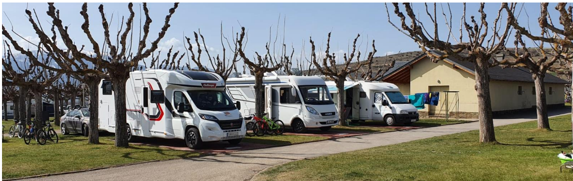
Stellplätze zum Tarif Camp&Go auf dem Campingplatz Pirineus (Guils de Cerdanya)