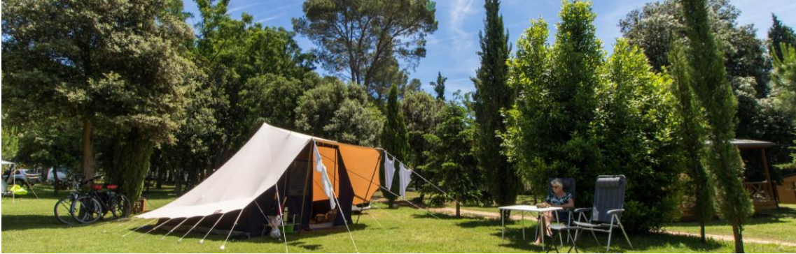
Stellplätze auf dem Campingplatz Begur (Begur)

dass sie fortlaufend daran arbeitet, negative Auswirkungen zu reduzieren und gleichzeitig die positiven Auswirkungen ihrer Tätigkeit zu maximieren.